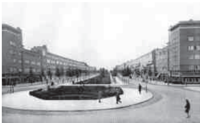
Afb. 10. Berlages 'breede verkeersweg' uitgevoerd met 'wandelpad' als Amstellaan in 1925 en als Vrijheidslaan met trambaan in 2010

De openbare gebouwen zijn door Berlage in de oorspronkelijke plankaart met verschillende kleuren aangegeven, de meeste in grijs of zwart (op de presentatiekaart zijn ze niet als zodanig herkennen, maar wordt hun naam soms vermeld). Tien gebouwen komen slechts één keer voor en worden in de toelichting specifiek genoemd: het reeds bestaande 'stadion' in het westen, het nieuwe '(Zuider)station', een 'Academisch Ziekenhuis' in het noordoosten, een 'tramremise' aan de Amstel, een 'Academie van Beeldende Kunsten' halverwege het Noorder Amstelka-