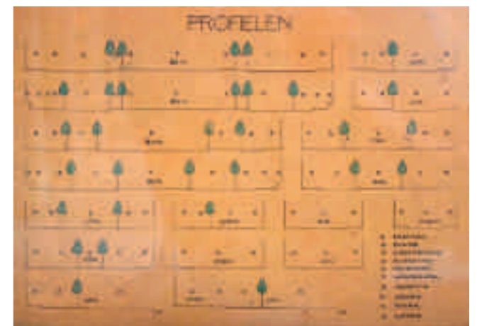
Afb. 8. H.P. Berlage, profielen, 1915 (Amsterdam Museum)

Bij de woorden die Berlages tijdgenoten gebruiken voor de ontworpen woningen zien we net als bij de openbare ruimten meerdere woorden voor dezelfde referenten. Omdat bij woningen de referenten duidelijker te onderscheiden zijn (waar straat en weg overlappende categorieën zijn, behoort een huis immers maar tot één klasse) is de situatie hier bovendien eenvoudiger. Voorbeelden zijn naast 'villa' al sporadisch 'twee onder een kap', 'hee-