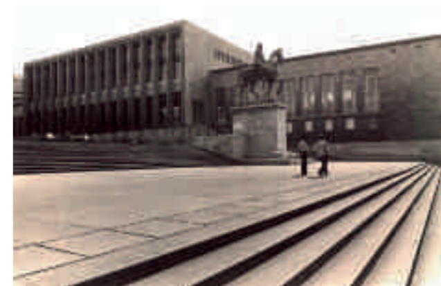
Afb. 1. Zicht op de voorgevel van de Koninklijke Bibliotheek van België op de Kunstberg kort na oplevering

werpen op een van hun grootste naoorlogse interieurprojecten in België. 3