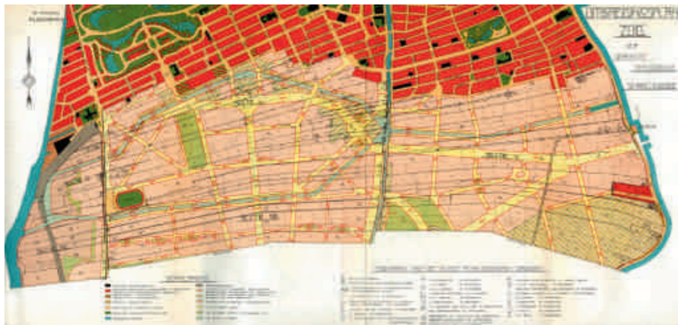
Afb. 5. B en W Amsterdam, 'Geraamteplan', 1917 (Stadsarchief Amsterdam)

Op de plankaart kunnen tot slot achttien pleinen en pleintjes worden onderscheiden, waarvan Berlage er in zijn toelichting