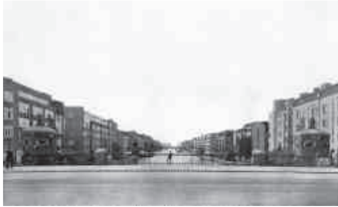
Afb. 9. Berlages 'gracht' uitgevoerd met groene oevers als Amstelkanaal in 1925 en 2010, gezien vanaf de Amstel

renhuis' en simpelweg 'huis' of 'woonhuis' voor 'ééngezinshuis', 'bovenhuis/-woning' en 'benedenhuis/-woning' voor 'tweegezinshuis', en 'arbeiderswoning' voor '3de klasse woning' of 'volksklassehuis'. 71